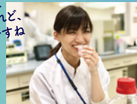
人の五感による分析