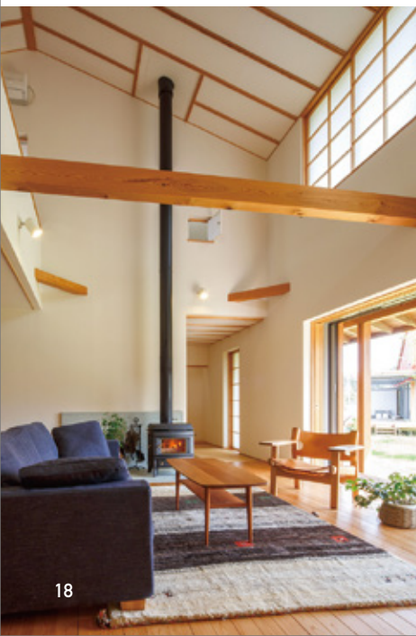
◀お客様の理想の暮らしを実現するナレッジライフこだわりの家

家は理想の暮らしを営むための大事な場所。一生に一度の大きな買い物なので絶対に後悔はさせたくありません。理想の暮らしを実現するために、お客様のイメージを丁寧に伺い、他のスタッフと一緒に家をつくり上げていくことが私の仕事です。しっかりとした提案ができることや、お客様に信頼してもらえることが本当に重要なんです。